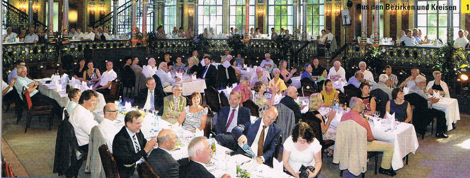
Festlicher Rahmen: 250 Gäste waren zur Ehrenamts gala ins historische Kurhaustheater nach Augsburg gekommen.